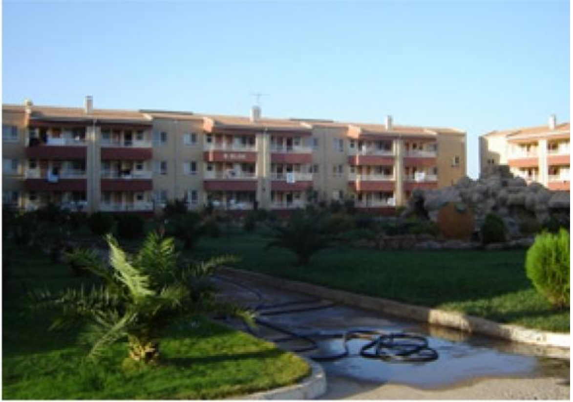
Karaali Kaplıcaları (Havuz)