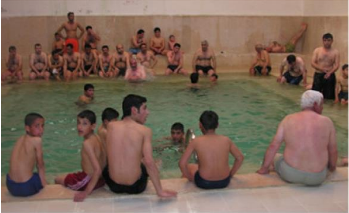
Karaali Kaplıcaları (Tesis)