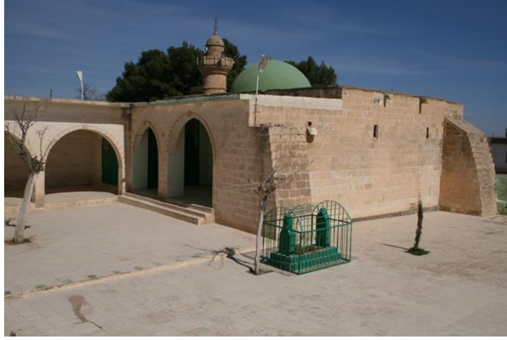
eyh Müslüm Türbesi