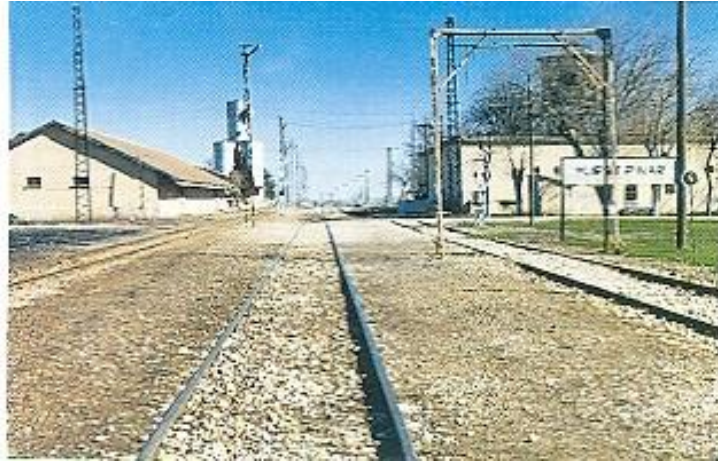
Mür İtipinar Kapısı

İlçenin 18 km güneyinde Suriye sınırı çizgisinde yer alan bir yerleşim birimidir. Mür İtipinar Köyü, Suriye sınırı kapısının bulunması ve Gaziantep-Kurtalan demiryolu üzerinde bir istasyon olması nedeniyle, ticaret ve ulaşım açısından doğu-batı arasında bir bağlantı noktasıdır. Urfa'nın Akçakale ve Ceylanpınardan sonra Suriye topraklarına açıldığı yer bir sınırı kapısıdır. Ankara Antlaşmasıyla tren hattı, sınırı olarak kabul edildiğinden, ikiye bölünmüş, büyük bir kısım Suriye topraklarında kalmış, t.r.