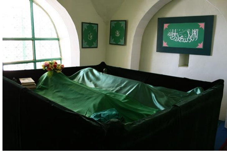
eyh Müslüm Türbesi içten Görünüm