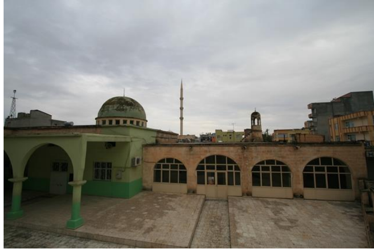
Ahmed-i Bican Camii